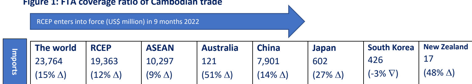
Figure 1: FTA coverage ratio of Cambodian trade